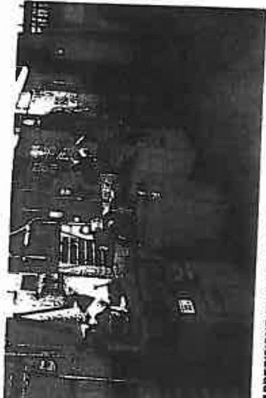
PRECISIONE AL SERVIZIO DEL CLIENTE