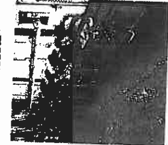
Una dei macchinari della Tecnoplastica

Grande impegno viene rivolto al miglioramento della qualità, con personale specializzato «Pronti a soddisfare qualsiasi esigenza dei clienti»