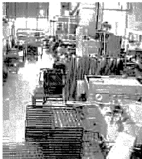
Alcuni macchinari dell'azienda Ilme

Una modalità diversa di approccio e di contatto con chi opera nel settore, anche per chi da diversi anni si è affermato grazie alla grande esperienza messa in campo. «La nostra azienda è nata nel 1980 e siamo un'impresa ancora a conduzione familiare, con 9 dipendenti - continua Galbusera - In questi anni abbiamo cercato di puntare sull'automatizzazione con l'installazione di robot che ci permettono di lavorare su